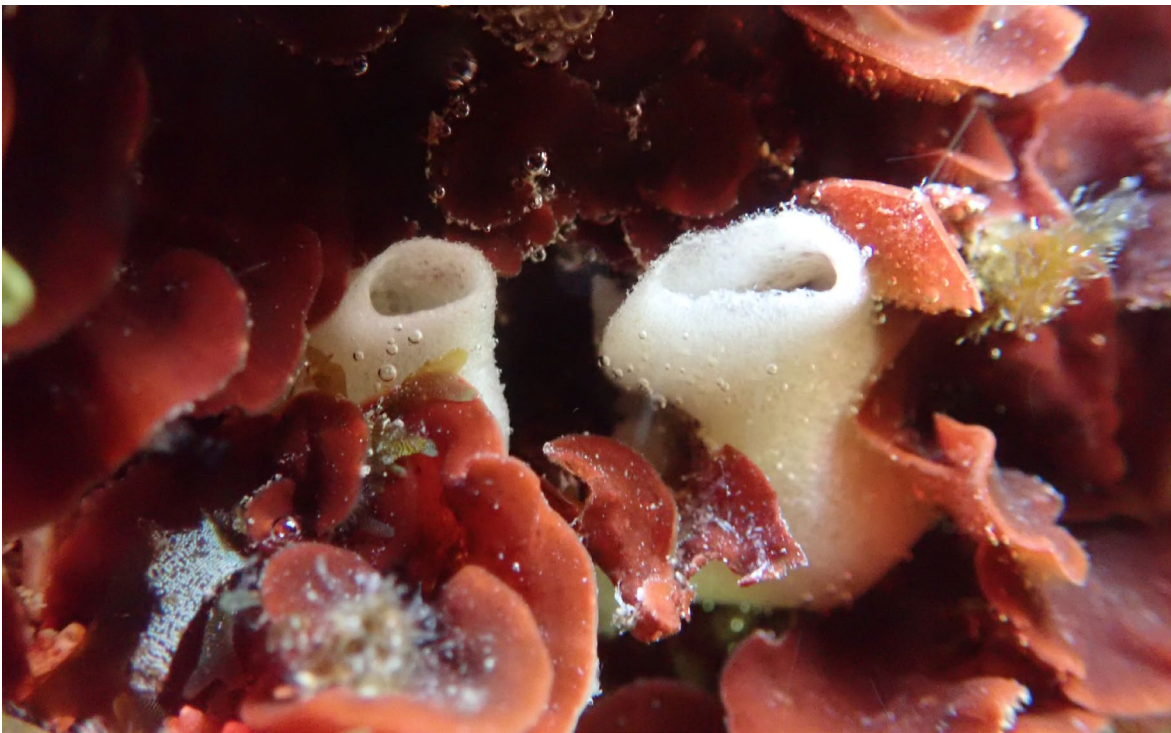
Figura 1. Imatge de l'esponja invasora Paraleucilla magna (blanca) amb l'alga roja Peyssonellia squamaria .

Actualment, l'esponja Paraleucilla magna és l'única declarada invasora a la Mediterrània. 1, 2