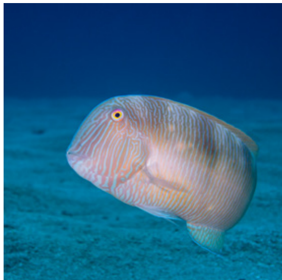
Figura 1. Fotografia d'un raor ( Xyrichthys novacula ).

S'ha comprovat si hi ha diferències significatives en les abundàncies màximes de les zones colonitzades per la macroalga invasora Halimeda incrassata i les àrees on aquesta macroalga no s'ha establert mitjançant l'anàlisi de variàncies (ANOVA).