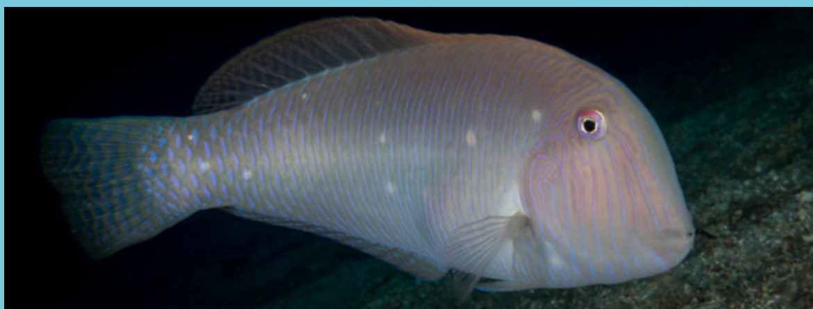
Fotografia d'un raor ( Xyrichtys novacula ).

A les zones colonitzades per la macroalga invasora Halimeda incrassata hi ha majors abundàncies relatives de raors. L'atracció dels raors per aquestes àrees envaïdes es pot deure al fet que creen hàbitat nou i afavoreixen l'augment de diverses espècies de crustacis que els serveixen d'aliment.